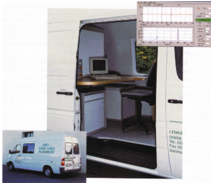
Bild 1: Ansicht von Meß- und Steuermodul des CDA-Diagnosesystems, installiert in einem Kabelmeßwagen